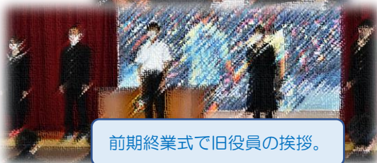
前期終業式で旧役員の挨拶。