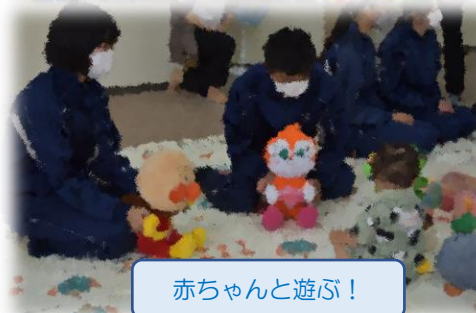
赤ちゃんとお遊び!