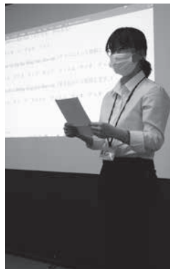
ベトナムにちなんだクイズで参加者を楽しませるモさん

町教委の国際交流事業。歌やクイズを交え、同じ言葉でも発音によって意味が異なるベトナム語の難しさを教えた2人は最後に手作りの揚げ春巻きをプレゼントし、好評でした。