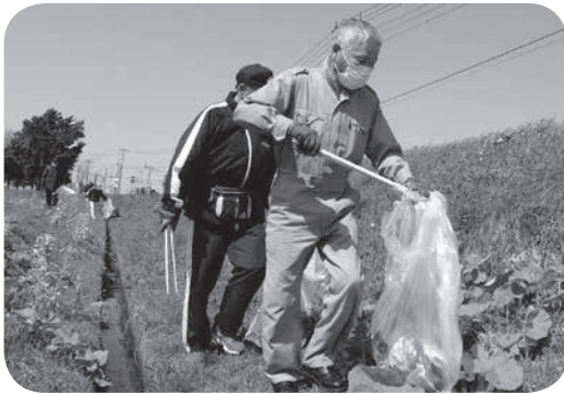
山1線の道路沿いで行われたごみ拾い 5月10日