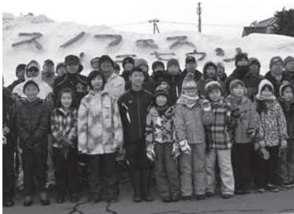
スノーフェスティバル参加者と記念撮影

共同開催 JA北いぶき青年部妹背牛支部 JA北いぶき女性部妹背牛支部 フレッシュユミズ会 町商工会青年部