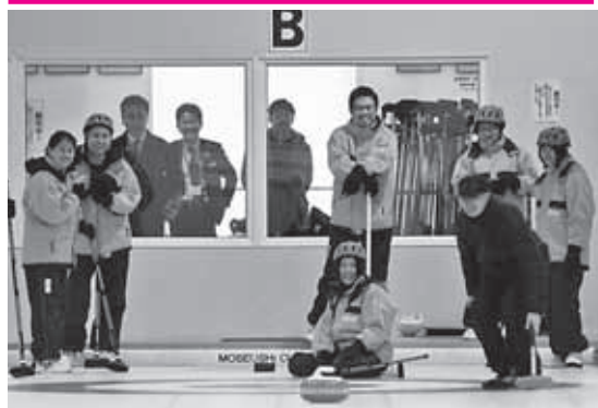
カーリング体験を楽しむ海外旅行者

北空知の各市町（深川、妹背牛、秩父別、北竜、沼田）で作る「北空知観光ネットワーク」。1市4町が連携を図り、観光を中心に北空知の魅力在国内外へ発信しようと中国とマレーシアの旅行業者を招き、2月13日～15日の日程で体験を主としたツアーを企画。北空知の魅力をPRしました。初日は妹背牛でのカーリング体験。経験者はなく、歩行練習からスタート。後半はミニゲームを楽しむ、昼食はペルで石焼ランチを堪能。大黒屋菓子舗でショッピングを楽しみ沼田町へ。化石発掘体験やあんどん会館の見学。また、ほろしん温泉ほたる館では茶道を体験。期間中は深川、秩父別、北竜を巡り、それぞれ町の魅力をPRしました。