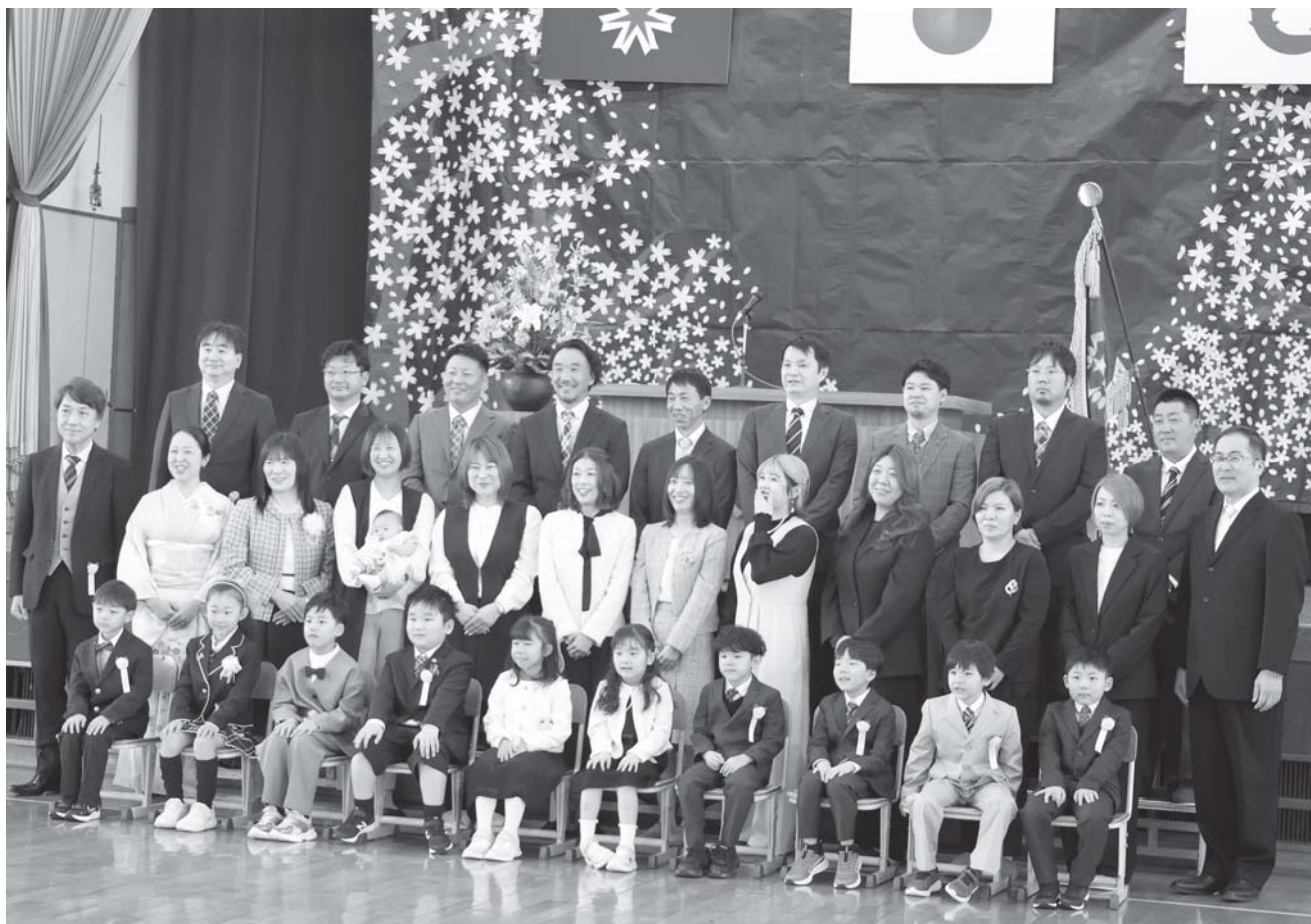
▲妹背牛小学校入学式