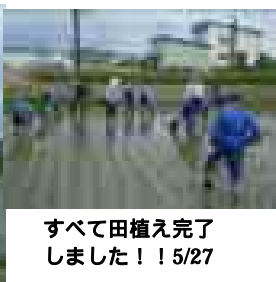
すべて田植え完了 しました！！5/27