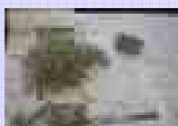
土がついている部分を とりのぞきました！ 視聴覚準備室（カーテン有 り）で乾燥させています

5月28日、「ルバーブジャム」を試作しました。4時間砂糖につけたもの（赤・緑）試作直前に砂糖を入れたもの（赤・緑）茎の細いもの（赤）の5種類のジャムを食べ比べました。また、2～3日後の、味の違いも調査しました。時間の違いや色の違いで甘さに変化がありました。今後ジャム主任の佐藤さんを中心に本校のジャムのレシピを完成させ、次はネーミング・パッケージデザイン作成です！