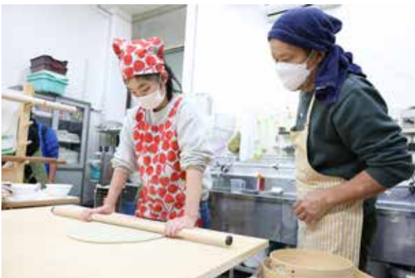
講師に教えてもらいながら、生地を均一にのばす参加者