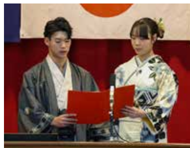
出席者代表のあいさつ