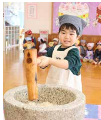
きねを振り下ろして、もちつきに挑戦する園児

認定こども園妹背牛保育所で12月に恒例のもちつき会が行われました。園児たちはきねを握り、「よいしょ！」と元気な掛け声に合わせて