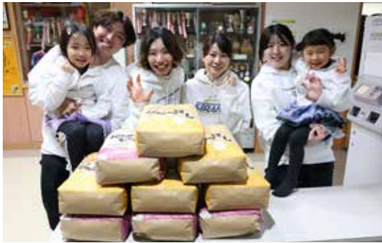
副賞のお米を前に優勝を喜ぶ 「STRAHL+」の選手たち

今年で30回目の節目を迎えた「2026ミックスカーリング妹背牛大会」（妹背牛カーリング協会主催）が、1月11日、12日の2日間、妹背牛町カーリングホールで開催されました。本大会は1995年に旧端野町（現北見市端野町）で行われていた大会を引き継ぎ、妹背牛町で第1回を開催。以来、交流企画や妹背牛産米の贈呈が好評を博し、道内有数のミックスカーリング大会へと発展してきました。