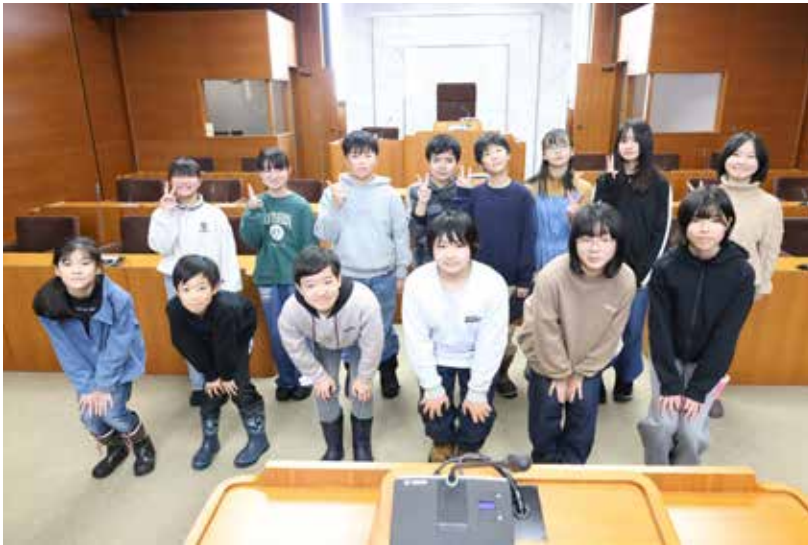
一般質問を終え、議場で記念写真に収まる6年生

妹背牛小学校の児童が「一日議員」となり、まちづくりの課題やアイデアを町に提言する「子ども議会」が12月18日、町議会議場で開かれました。