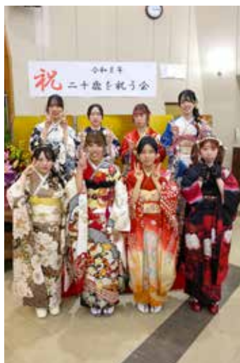
晴れ着姿で記念撮影

記念写真を撮影した後、小学6年生の時に埋めたタイムカプセルの中身が配られ、出席者たちは当時の思い出が詰まった品々に懐かしそうな表情を浮かべました。