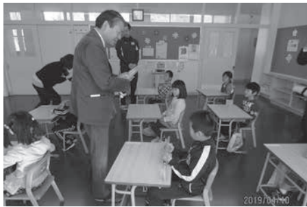
新入学児童へ黄色い傘贈呈