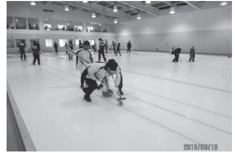
妹背牛ロータリークラブ杯ジュニアカーリング大会