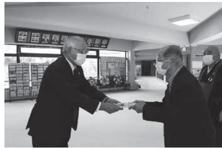
今年の9月14日に社会福祉協議会へのご寄附をいただきました。