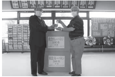
救急リレーバトンの寄贈