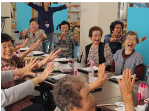
「わかち愛もせうしひろば」での活動

誰もが安心して暮らし続けられるまちづくりを進めるため、生活基盤の整備や健康保持増進事業、さらには予測不能な災害時にも対応できる地域防災力の強化を図る。町民が住み慣れた地域で楽しく暮らし続けられるよう地域活動団体の育成・支援を行う事業。