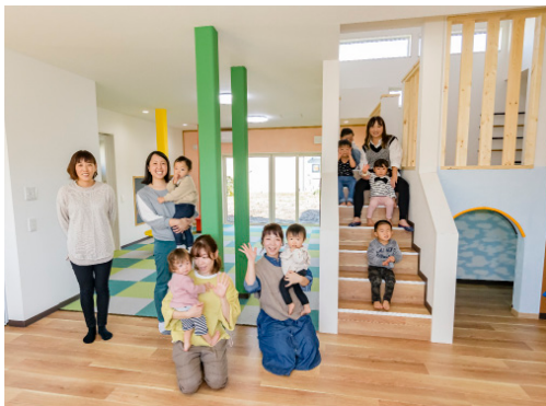
空き家を改修した「子育て世代交流施設」

結婚から出産、子育てまできめ細やかに経済的・精神的負担の軽減に取り組むとともに、若い世代の意見・要望を尊重できる環境づくりを行い、希望をもって子どもを産み育てることができる事業。