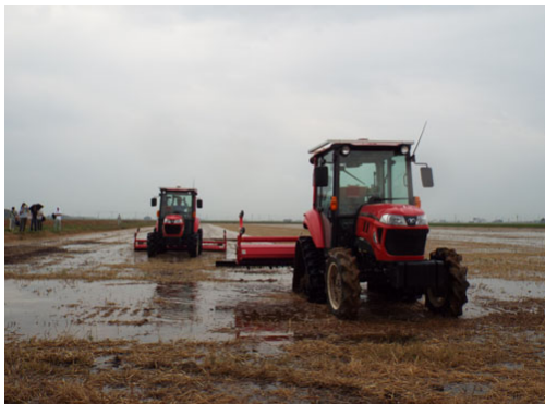
無人トラクターの実証実験

基幹産業である農業は、スマート農業を推進し、若い世代が進んで後継ぎできる環境をつくる。さらに商工業では、商工会と連携を図り、各種支援事業を進めるとともに、新規雇用創出に向けた支援事業を行う。また、年々増え続けている外国人技能実習生等の生活サポートを行い、若い世代が地域で働きやすい環境を整備する事業。