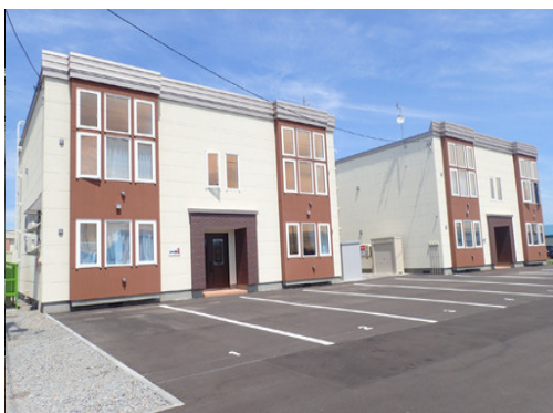
定住促進賃貸住宅事業で建設した住宅

本町の観光拠点の中心となる「妹背牛温泉ペペル」が開業から約30年経過することから、交流人口の増加を図るため、リニューアルを行う。また、移住者を迎え入れるための支援事業の充実、短期滞在型のワーケーションなどの移住・定住に向けた取り組み強化を図る事業。